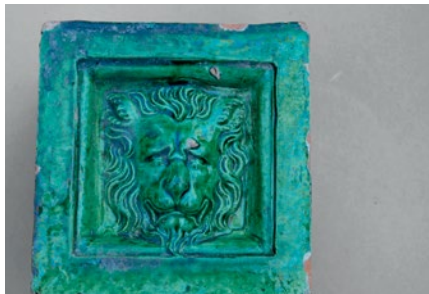
Quadratische Ofenkachel mit Löwenkopf, um 1600.

Wie bei den Neuenburg-Tagungen üblich, richtet sich die Veranstaltung nicht nur an Fachwissenschaftler, sondern zugleich auch an die breitere interessierte Öffentlichkeit.